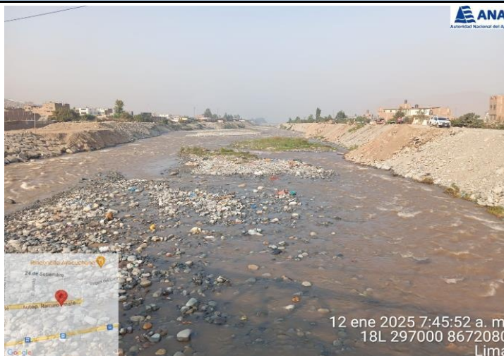
ZONA COLMATADA DEL RIO RIMAC